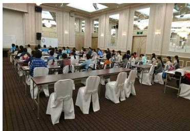
テスト当日・保護者説明会の様子

・お子さんが緊張感を持ってテストに臨めるよう、佐久・上田とも、外部会場での実施としております。普段とは違う環境で、全国一斉に挑戦する年2回の「学力甲子園」です。 ・保護者説明会では、入試制度改革や入試問題分析はもちろん、保護者の皆様にも参考にしていただける内容をお伝えしてまいります。